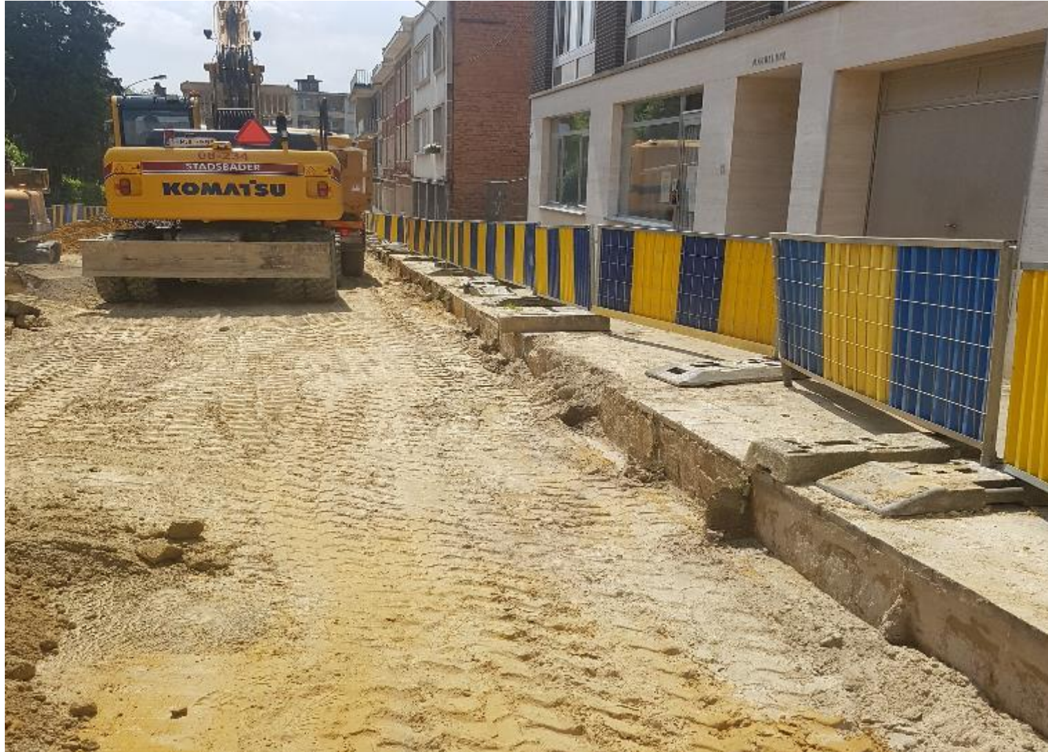
Illustration enlèvement de la voirie existante