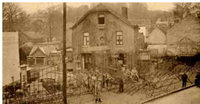
Les établissements Hernasteens