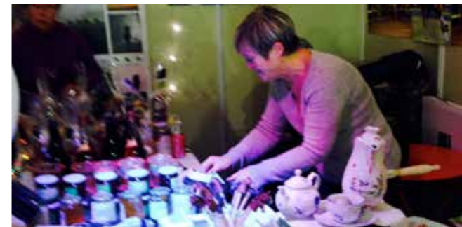
Stand Chantilly au marché de Noël

Le principe du Coworking c'est : un espace de travail partagé, une collaboration professionnelle, le partage de réseaux et l'échange de compétences. Une manière de lutter contre l'isolement professionnel et de booster ses compétences au travers de celles des autres. En 2011, Office Brussels a ouvert ses portes