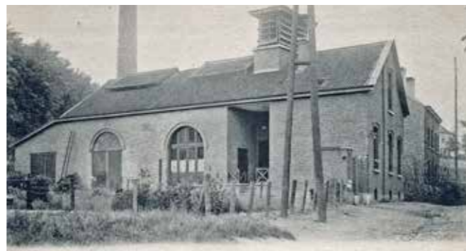
Usine électrique - Elektrische centrale